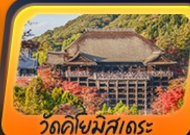
วัดคิโยมิสุเดระ