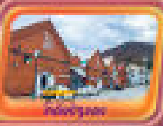
เมืองซัปโปโร