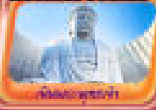
เมืองซัปโปโร