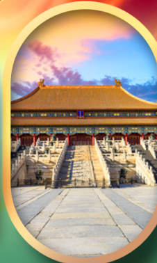
พระราชวังฤดูง