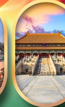
พระราชวังกุ๊กง