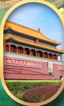
จัสมตรีสเทียนอันเหมิน