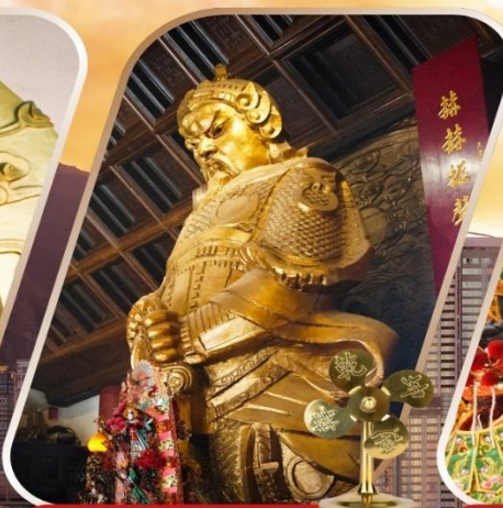
CHE KUNG (SHA TIN)