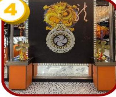
ศูนย์ฮวงจู้กั๊กหัน