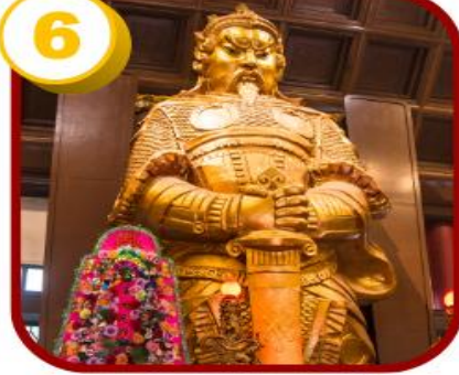
วัดแซกง (ซ่าถิ้น)