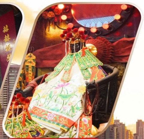
KWAN YUM HH