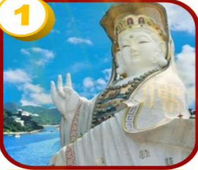
รีพลัสเบย์