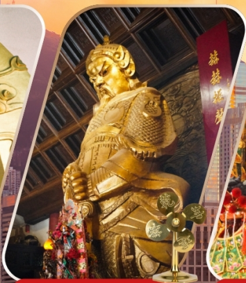
CHE KUNG (SHA TIN)