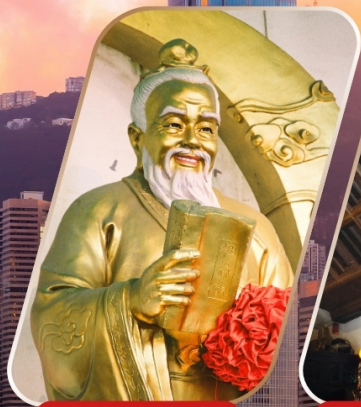
WONG TAI SIN