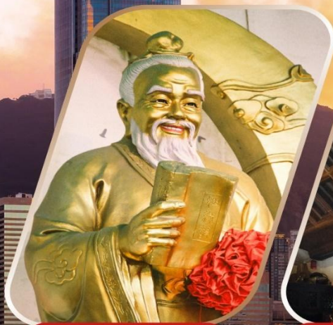
WONG TAI SIN