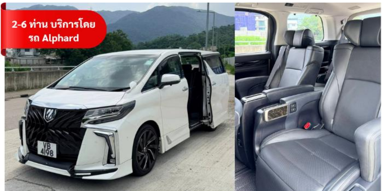
2-6 ท่าน บริการโดย รถ Alphard

** คอนเฟิร์มโรงแรม 3 วันก่อนเดินทาง ในกรณีโรงแรมที่เสนอเต็มบริษัทขอสงวนสิทธิ์ เปลี่ยนเป็นโรงแรมอื่น 3 ดาวตามมาตรฐานฮ่องกง โดยไม่ต้องแจ้งให้ทราบล่วงหน้า **