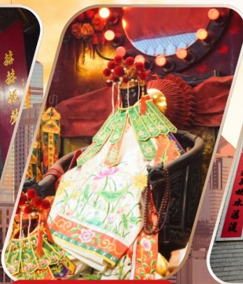
KWAN YUM HH