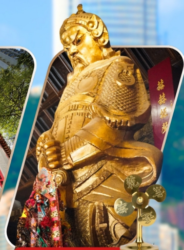
CHE KUNG (SHA TIN)