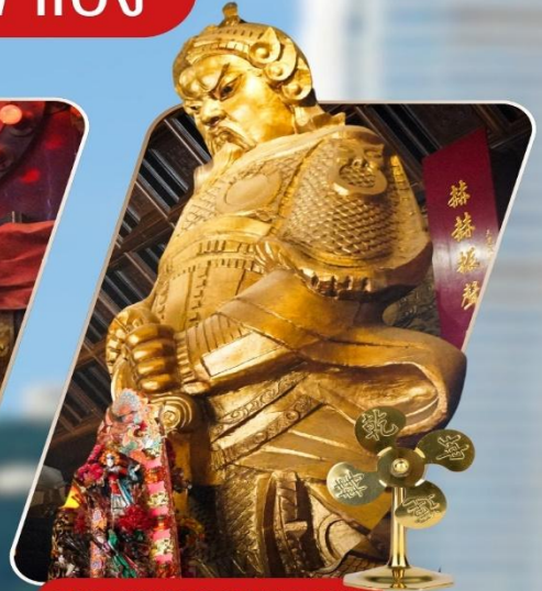
CHE KUNG (SHA TIN)