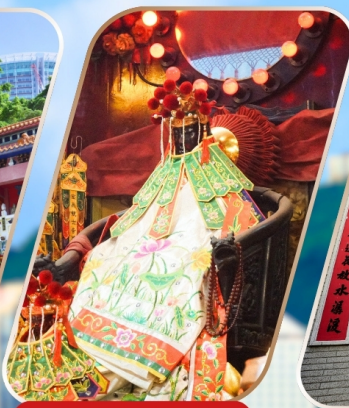
KWAN YUM HH