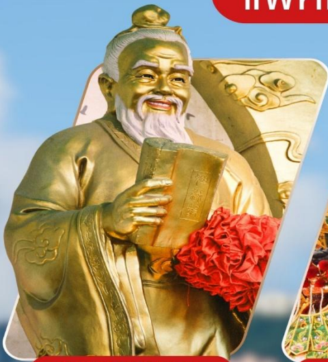
WONG TAI SIN