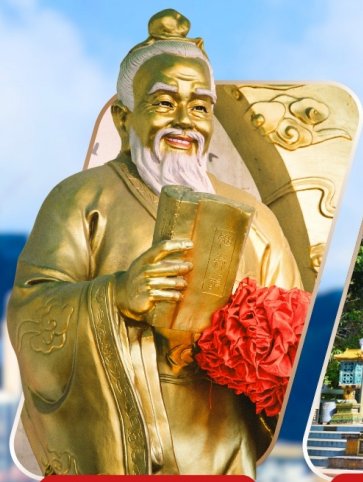
WONG TAI SIN