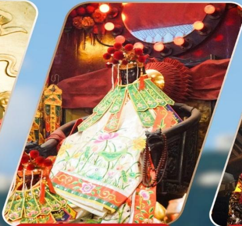
KWAN YUM HH