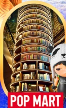
POP MART หอสมุดจงชู่เก๋อ