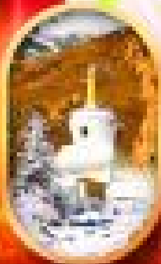
อุทยานสัตว์ป่า