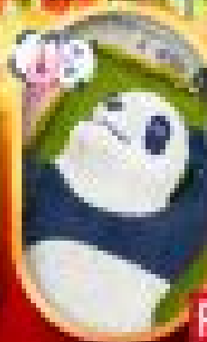
สวนสัตว์แห่งชาติ