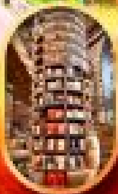
อุทยานเมืองเก่า