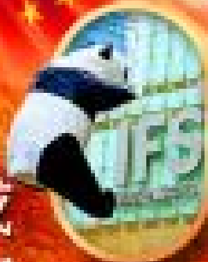
สวนสัตว์ป่านานาชาติ