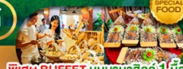
SPECIAL FOOD พิเศษ BUFFET; บันบานาฮิลล์ 1 มื้อ และ SEAFOOD BOAT เดินทาง มี.ค. - ต.ค. 69