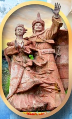
เมืองโบราณชางพาน