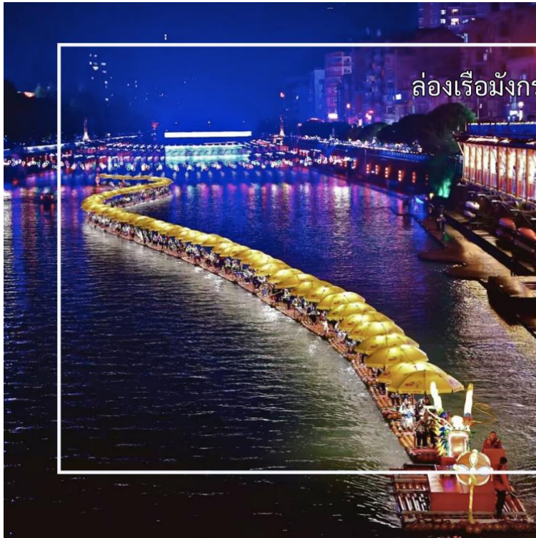
ล่องเรือมังกรแม่น้ำก้งสู่ย

นำท่านสัมผัสประสบการณ์สุดพิเศษ ล่องเรือมังกรแม่น้ำก้งสู่ย ชมวิวยามค่ำคืน เป็นหนึ่งในแม่น้ำที่มีความงดงามและสำคัญ มีชื่อเสียงจากทิวทัศน์ธรรมชาติที่อุดมสมบูรณ์ ริมฝั่งเต็มไปด้วยป่าไผ่ ป่าเขา และภูเขาหินทรายสลับซับซ้อน สายน้ำใสไหลเย็นตัดผ่านหุบเขา สร้างทิวทัศน์ที่งดงามดุจภาพวาด