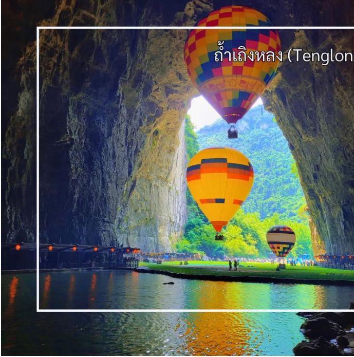
ถ้ำเถิงหลง (Tenglong Cave Scenic Area)

นำท่านสู่ ถ้ำเถิงหลง(TengLong Cave) สถานที่ท่องเที่ยวระดับ 5A หนึ่งในถ้ำหินปูนที่ใหญ่และงดงามที่สุดของจีน ได้รับการขนานนามว่าเป็น ราชาแห่งถ้ำคาสต์ ด้วยความอลังการของธรรมชาติที่ก่อกำเนิดมากกว่า 300 ล้านปี ตัวถ้ำมีความยาวมากกว่า 50 กิโลเมตร แบ่งออกเป็นถ้ำแห้งและถ้ำเปียก ภายในเต็มไปด้วยหินงอกหินย้อยรูปร่างแปลกตา โถงถ้ำสูงใหญ่ โอ่อ่า มีลำธารใสไหลผ่านกลางถ้ำ ตลอดเส้นทางยังมีการจัดแสงสีตระการตา เพิ่มบรรยากาศเสมือนเดินทางอยู่ในดินแดนแฟนตาซี