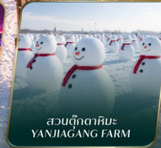
สวนตุ๊กตาหิมะ YANJIAGANG FARM