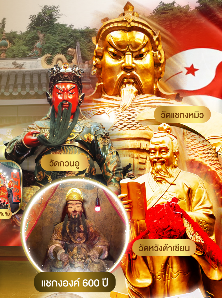
วัดเซกงหมิว