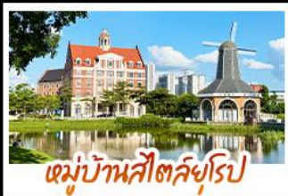
หมู่บ้านสโตนเฮลล์ยุโรป

ล่องเรือชมดอกไม้สีขาวบานเหนือสายน้ำ ณ เมืองคูอินเสียงส่าย หนึ่งในปีหนึ่งครั้ง ถ่ายรูปเช็คอินแบบชิคๆ ณ หมู่บ้านสโตนเฮลล์ • ชม UNSEEN แห่งป่าหม่า ล่องเรือชมทะเลในท่า ณ ซันเหมินไห่ เหมือนแคสเคดสวรรค์ • ชมน้ำพุร้อนฟ้า ที่ท่องเที่ยวระดับ 4A • ชมความอลังการของ น้ำตกสองแผ่นดิน จีน-เวียดนาม ณ เต๋อเทียน • ทำน้ำแข็งหลอดกับประติมากรรมน้ำแข็งสวยงาม และอากาศดีลบล • ชมดอกไม้คาบูกูกาล ณ เวาซิงชิว พร้อมขอพรเจ้าแม่กวนอิมพันกร