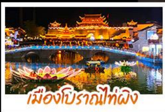
เมืองโบราณไม้ที่ผิง