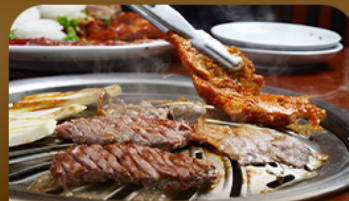
เมนูย่างสโตร์เกาหลี