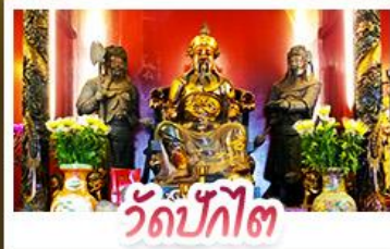
วัดปักโก๊ต