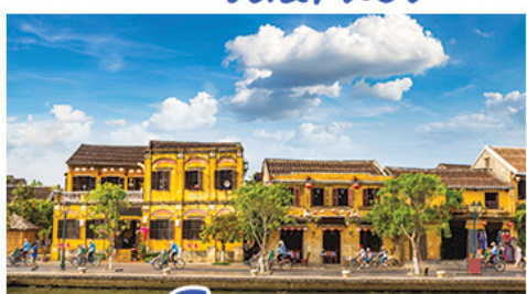
เมืองโบราณฮองอัน