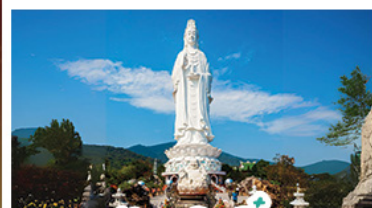
วัดเลิ๊ง