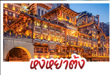
แดงเขมาตัง