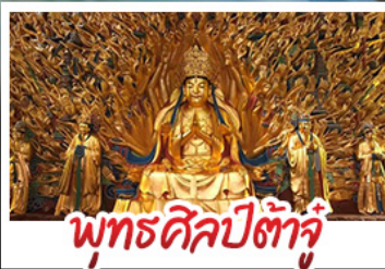
พุทธศิลป์ต้าจู้