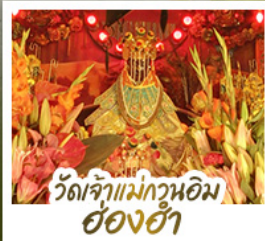
วัดเจ้าแม่กวนฮ้ดงฮ่า