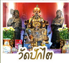
วัดป้ก้ไต้