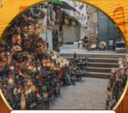
ตลาดบ้านเอลคาลิ