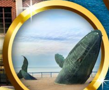
ประติมากรรมวาฬผู้โดดเดี่ยว