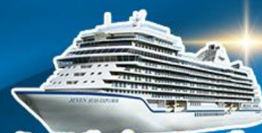
พักบนเรือสำราญ 2 คืน