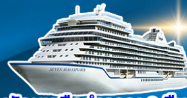
พักผ่อนเรือสำราญ 2 คืน