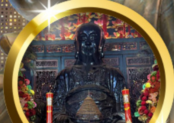
เทพเจ้าปิกไต่ ซิชชนะในชีวิต