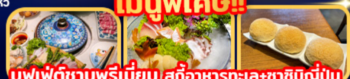
เมนูพิเศษ!! บุฟเฟ่ต์ซาบูพรีเมียม สุกี้อาหารทะเล+ซาซิมิญี่ปุ่น ดื่มชาระดับมิชลินสตาร์