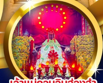
เจ้าแม่กวนอิมฮ่องกง ร่ำรวยเงินทองไหลมาเทมา