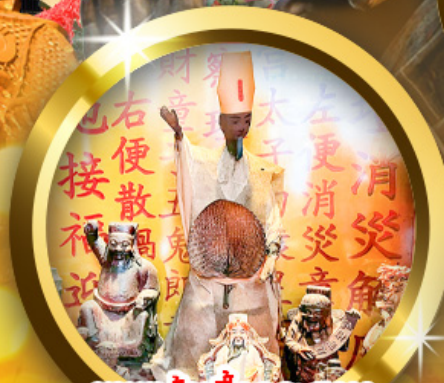
เทพเจ้าเสื่อกระสอบ พิธีลูบพัดโบราณ