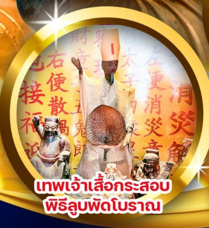
เทพเจ้าเสื่อกระสอบ พิธีลูบพัดโบราณ