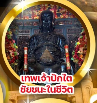
เทพเจ้าปิกไต่ ชัยชนะในชีวิต