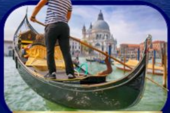
เที่ยวเกาะเวนิส