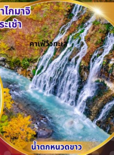
คาเฟว็งกะเอ