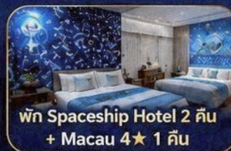
พัก Spaceship Hotel 2 คืน + Macau 4★ 1 คืน