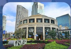
สตาร์บิคใหญ่ที่สุดในเอเชีย