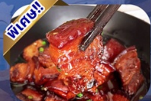
พิเศษ!! เมนูหมูสามชั้นตุ๋นน้ำแดง

พักโรงแรม 4 ดาว ★★★★★ ฟรี ประกันอุบัติเหตุ บริการอาหารท้องถิ่น