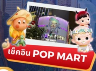
เชคอิน POP MART