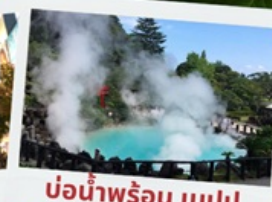
บ่อน้ำพุร้อน เบลปู

หมู่บ้านยูฟูอินฟลอร์ริล ทะเลสาบคินริน ทะเลสาปคินริน บ่อน้ำพุร้อน อุมิจิโกกุ ท่าเรือโมจิโกะ เรโร ตลาดปลาคาราโตะ ศาลเจ้ามียาจิดาเกะ ดิวตี้ฟรี ฟุกุโอกะ เบย์ พลาซ่า ช้อปปิ้งออน มอลล์ หินคู่เมโอโตะอิวะ ชมดอกไม้ไฮเดรนเยีย รอบน้ำตกชิราอิโตะ ช้อปปิ้งย่านเท็นจิน