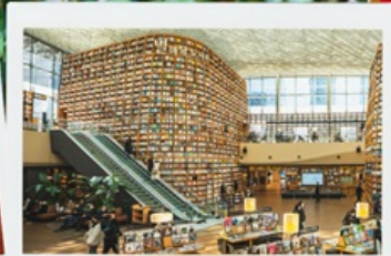
ห้องสมุด สุดชิค