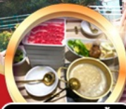
บุฟเฟ่ต์ชาบู เมียร์โมอัน!!