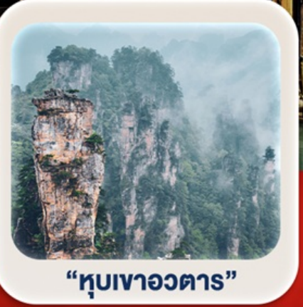
“หุบเขาอวตาร”