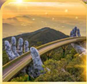
สะพานมือยักษ์

ดานัง ฮอยอัน บานาฮิลล์ เที่ยวบานาฮิลล์เต็มวัน รวมบัตรเครื่องเล่น