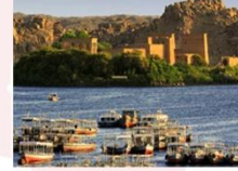
วิหารฟิเล

16.25 น. ออกเดินทางสู่กรุงโคโร สายการบิน Egypt Airlines เที่ยวบิน MS295