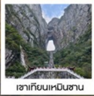
เขาคิเยนเหมินซาน

พิเศษ!!...รอบค่ำเช้าชุดพื้นเมืองที่ฟ่งหวง • รอบค่ำช่างถ่ายรูป น้ำตกฟูหรง