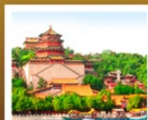
อวิ๋เหอหยวน