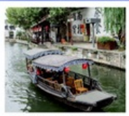
เมืองโบราณหนานชวน