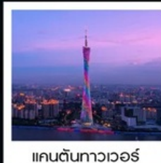
แคนตันทาวเวอร์