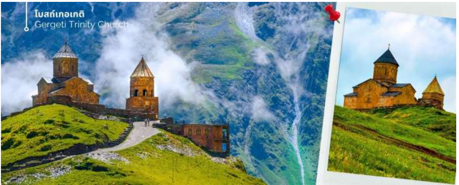
โบสถ์เทอเกติ Gergeti Trinity Church

จากนั้นออกเดินทางสู่ เมืองกูดาอูรี (ใช้เวลาเดินทางประมาณ 1 ชั่วโมง 30 นาที)