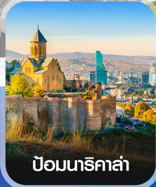
ป้อมนาริกาล่า