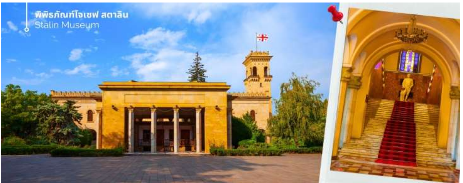
พิพิธภัณฑ์โจเซฟ สตาลิน Stalin Museum

ออกเดินทางต่อไปยังเมืองกอรี (ใช้เวลาเดินทางประมาณ 1 ชั่วโมง 20 นาที ) นำท่านเที่ยวชม พิพิธภัณฑ์โจเซฟ สตาลิน (Stalin Museum) ซึ่งที่เมืองนี้เป็นบ้านเกิดของโจเซฟ สตาลิน อดีตผู้นำสูงสุดของสหภาพโซเวียต สตาลินถูกยกย่องเป็นวีรบุรุษที่นำพาสหภาพโซเวียตให้รุ่งเรือง แต่ในขณะเดียวกันก็เป็นที่รู้จักในด้านการกดขี่ข่มเหงและการฆ่าล้างเผ่าพันธุ์ พิพิธภัณฑ์แห่งนี้จึงเป็นแหล่งเรียนรู้เกี่ยวกับชีวิตและผลงานของสตาลิน รวมถึงผลกระทบที่เขามีต่อประวัติศาสตร์โลก