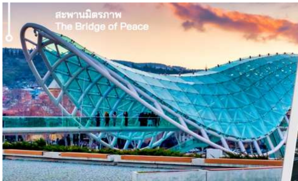
สะพานมิตรภาพ The Bridge of Peace

นำท่านเดินทางไปยัง สะพานสันติภาพ เป็นสะพานคนเดินรูปทรงโค้งสร้างจากเหล็กและ ทอดข้ามแม่น้ำคูราเชื่อมสวนริเกกับเมืองเก่าในใจกลางกรุงทบิลิซีนับตั้งแต่เปิดให้บริการในปี 2010 โครงสร้างนี้ได้กลายเป็นทางข้ามคนเดินที่สำคัญในเมืองรวมทั้งเป็นสถานที่ท่องเที่ยวที่สำคัญและเป็นหนึ่งในแลนด์มาร์คที่เป็นที่รู้จักมากที่สุดของเมืองหลวง สะพานซึ่งทอดยาว 150 เมตร ข้ามแม่น้ำคูรา ได้รับคำสั่งจากศาลว่าการเมืองทบิลิซีให้สร้างเป็นองค์ประกอบการออกแบบร่วมสมัยที่เชื่อมต่อกับทบิลิซีเข้ากับเขตใหม่ สะพานทอดยาวข้ามแม่น้ำคูรา ทำให้สามารถมองเห็นโบสถ์เมเตคีรูปปั้นของผู้ก่อตั้งเมืองวิกตัง กอร์กากาลีและป้อมนาริกาลาทางด้านหนึ่งและสะพานบาราตาซวิลีและพระราชวังพิธิการของจอร์เจียทางอีกด้านหนึ่ง