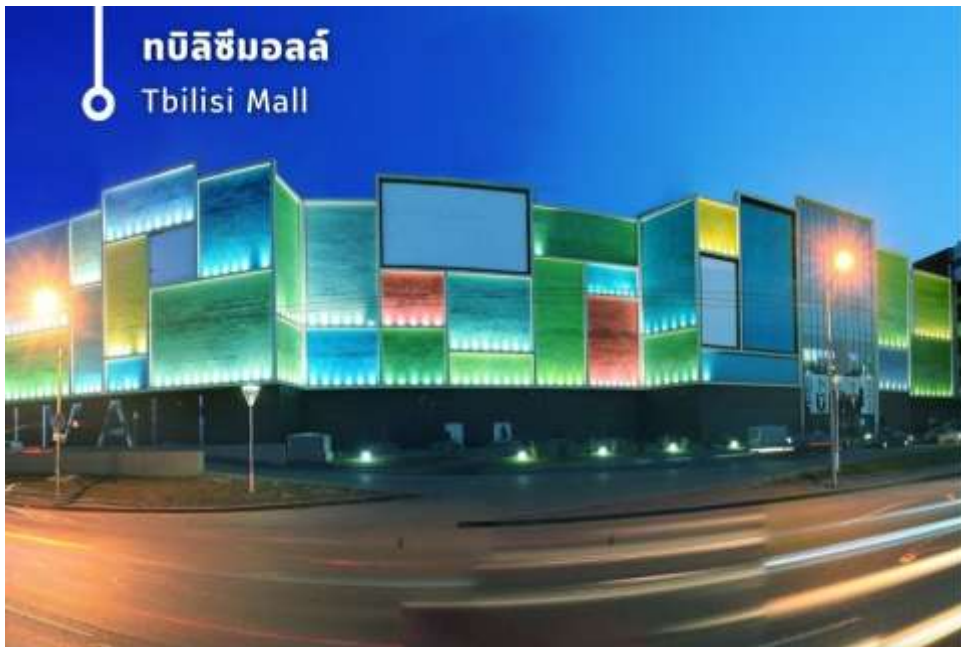
ทบิลิซิมอลล์ Tbilisi Mall