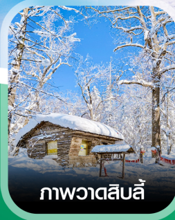
ภาพวาดสีบลู