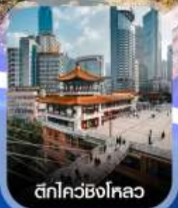
ตึกไควซิงโหลว

✈️ คอนเฟิร์มออกเดินทาง ทุกพีเรียด 2 ท่านขึ้นไป