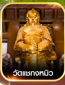
วัดแซงกหมีว