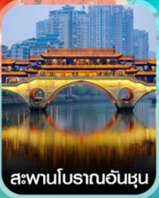
สะพานโบราณอันชุน