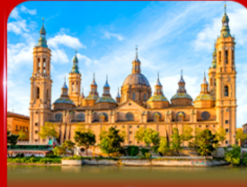
มหาวิหารแม่พระแห่งเสาคักดีสิกร์