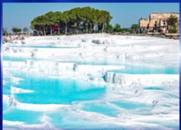
ปราสาทบุษบ้าย น้ำพุคคาเอ

OPTION JEEP SAFARI นั่งจี๊ปชมวิวคัปปาโดเกีย