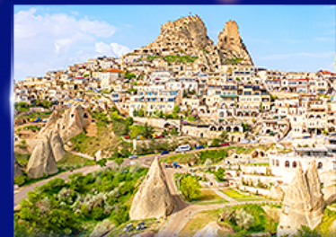
หุบเขาอูซึซาร์ คัปปาโดเกีย