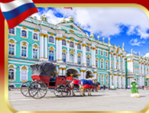
เช่าชมพิพิธภัณฑ์ออร์มิตา