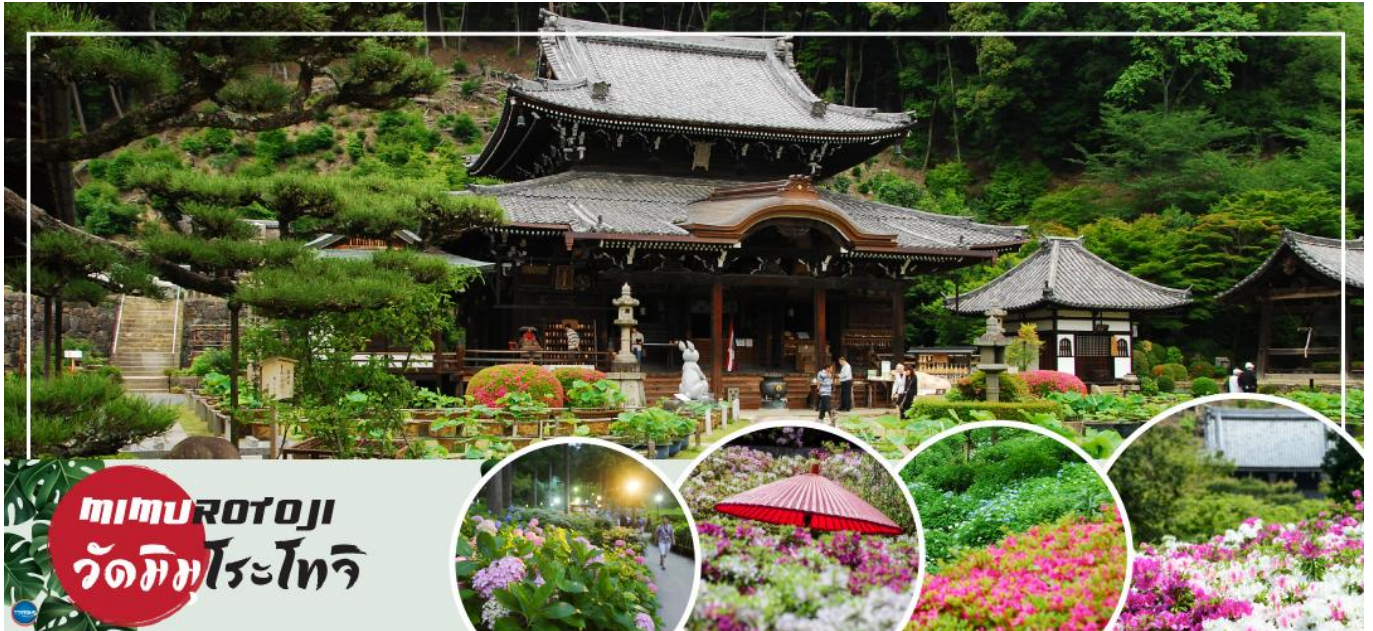
mimurotoji วัดมิมุโรโตะจิ

วันที่สอง ท่าอากาศยานนานาชาติคันไซ โอซาก้า – เมืองเกียวโต – วัดมิมุโรโตะจิ – เมืองนาโกย่า – แฉีช ดริม เอ๊าท์เล็ท