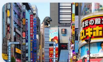
ซัปปังชินจูกุ