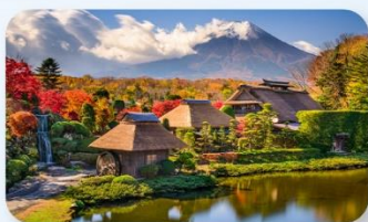
หมู่บ้านน้ำใสโอชิโนะฮัคโค

FUJI HOTEL AREA หรือเทียบเท่า NARITA HOTEL AREA หรือเทียบเท่า NARITA HOTEL AREA หรือเทียบเท่า