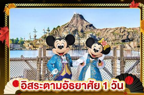
อิสระตามอริยาตสึ 1 วัน