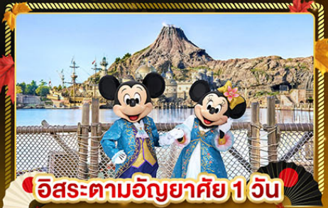
อิสระตามอริยาศัย 1 วัน