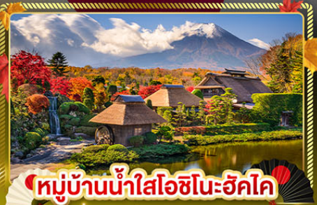
หมู่บ้านน้ำใสโอชิโนะฮักโค