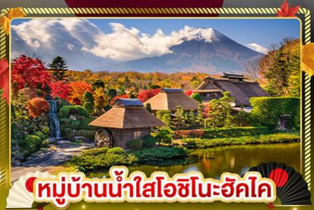
หมู่บ้านน้ำใสโอชิโนะฮักโค