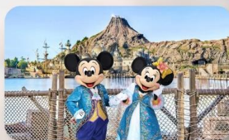
อีสะะตามอริยาศัย 1 วัน