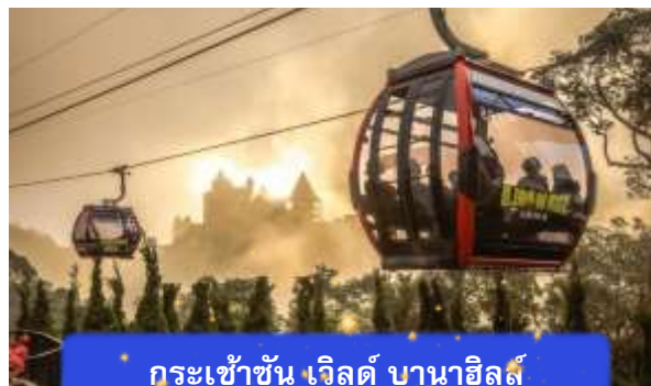
กระเช้าขึ้น เวิลด์ บานาฮิลล์