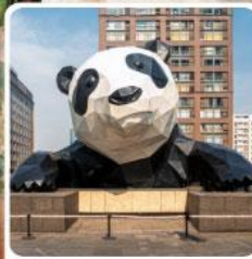
หมีแพนด้ายักษ์ป็นตึก