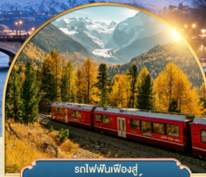
รถไฟฟันเฟืองสู่ ยอดเขากรอนเนอส์เกรต