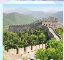
ตลาดร้อยปีเจิ้งหวิงเมี่ยว กำแพงเมืองจีน ด้านจวิ้ยกงวน